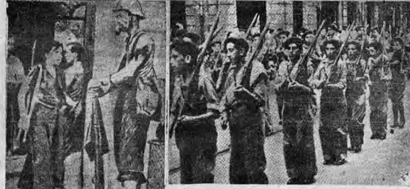
Izquierda: he aquí a uno de los típicos milicianos reclutados en Cataluña, prestando servicio en el frente de Aragón. A su lado puede verse también a una miliciana procedente de la misma región. Derecha: grupo de jóvenes reclutados por el gobierno de Madrid para las batallas que han tenido lugar en el frente de Bilbao.

Director: JOSE MARIA PINAUD. Viernes 9 de octubre de 1937. Año XVII. Número 4788