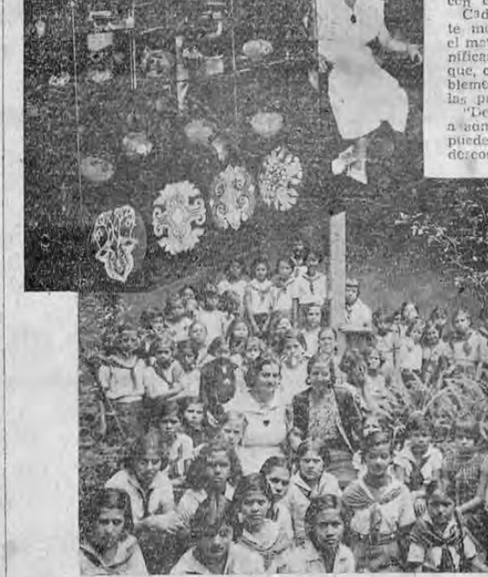
Muestra la fotografía algunos objetos pintados por la señora de Quesada, junto con su autora. —Abajo un grupo de escolares en momentos en que visitaban la exposición.

Su exposición ha sido admirada por todos los elementos artísticos de esta capital y por muchos escolares que por ella han desfilado. —Para diciembre prepara otra exposición más vasta y patrocinada también por el Círculo de Amigos del Arte